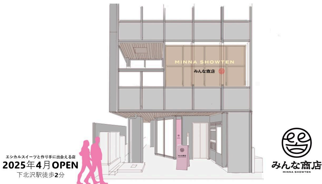
▲みんな商店の外観(イメージ)

1階は日本初のゼロ・ウェイストなスーパーマーケットをオープンした「株式会社斗々屋(ととや)」と協業し、スイーツや果物などを提供するテイクアウトを中心としたカフェをオープンします。特に発酵の力で体に優しく、保存性を高めた発酵フルーツを使用した「発酵スイーツ」や「発酵ドリンク」は健康に気を配る方や、規格外のフルーツの活用に関心がある方にオススメです。そのほかにもUPDATERがセレクトした社会課題解決に取り組む生産者の魅力的な一品が並びます。